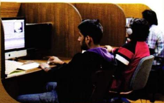
Students at the Editing Studio of Film wing.