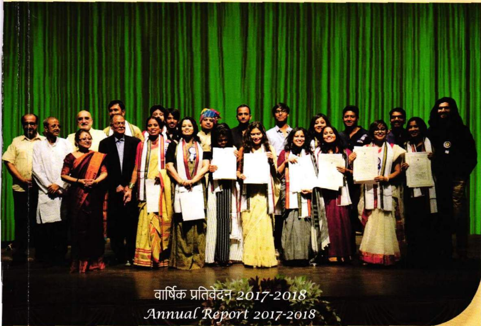
A view of the Convocation 2017 at SRFTI campus

भारत सरकार के सूचना और प्रसारण मंत्रालय के एक शैक्षणिक संस्थान