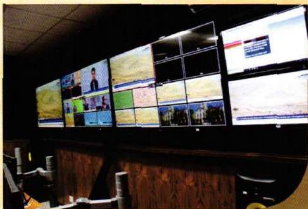
News Studio for the new Electronic & Digital Media wing.