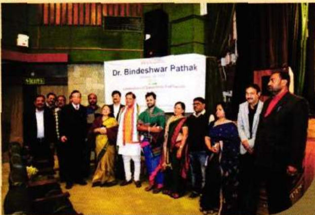
Dr Bindheswar Pathak, icon for Indian cleanliness movement at SRFTI during Swachhta Pakhwada program.