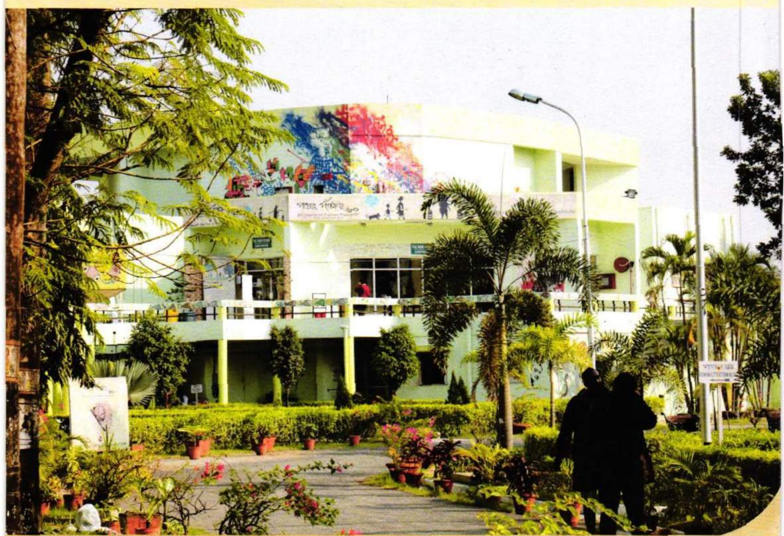
Main Auditorium at SRFTI