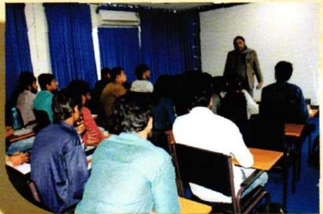
A view of the class at FTI, Itanagar, Arunachal Pradesh - an extended campus of SRFTI.