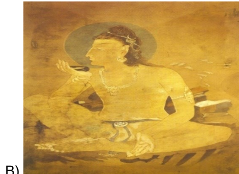
Shiva Drinks Poison