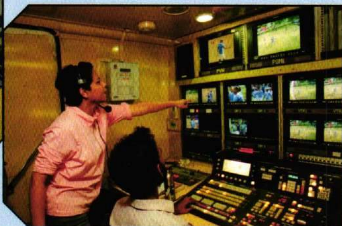
Live Sports Control Room in the OB Van – EDM Students' learning exercise