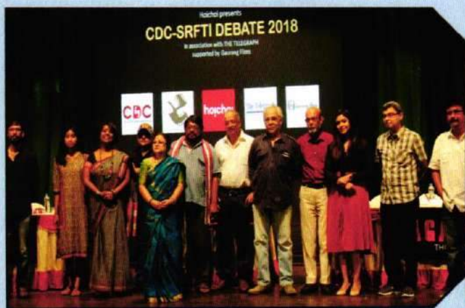
CDC – SRFTI - Debate