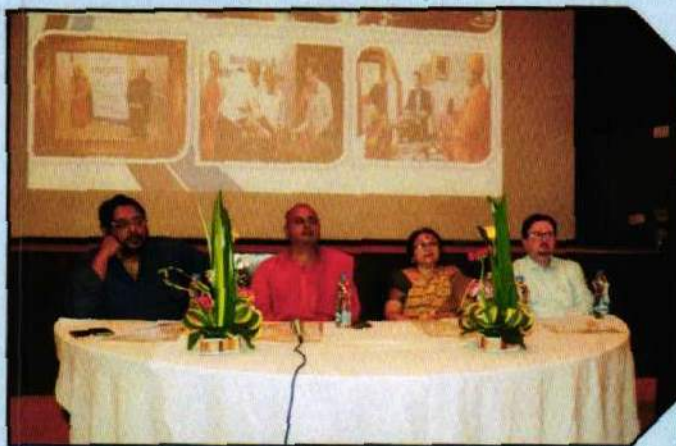
SRFTI's Short Course as Outreach Programme affiliated to NSDC (Govt. of India) in collaboration with Peerless Skill Academy & Ramakrishna Mission & Math