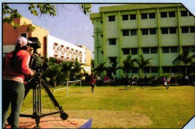
EDM Students on Live Sports practical class