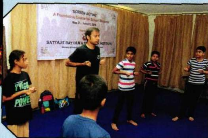
Summer School Acting Short Course for the School Children at SRFTI