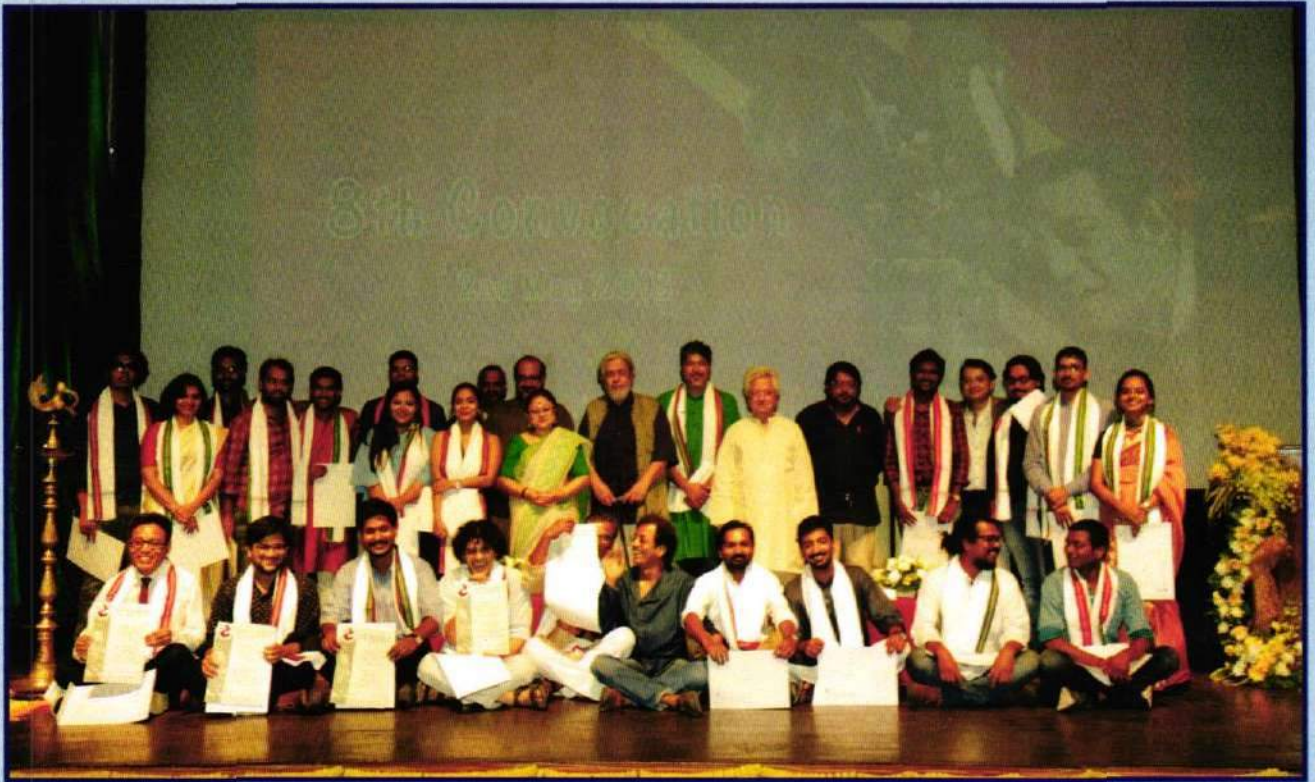
Convocation of the 11 th batch of students on 2nd May, 2018