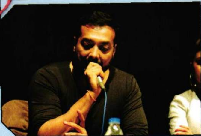
Master class by Shri Anurag Kashyap at SRFTI