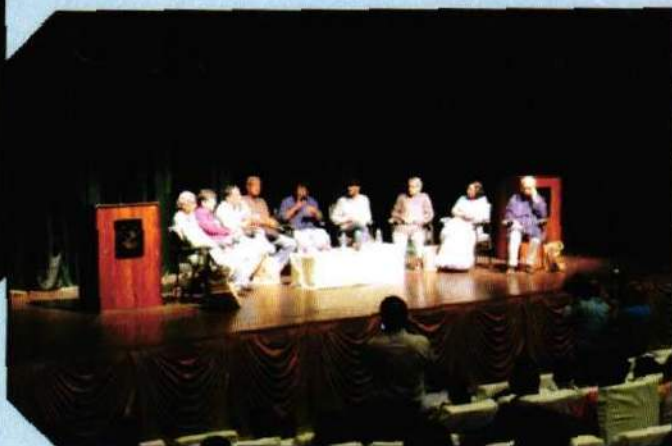
Workshop on 'Theatre on Screen'