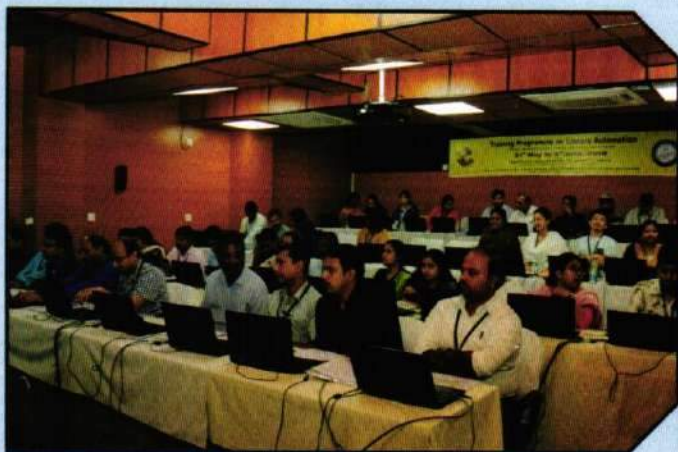
International Training Programme on 'Library Automation'